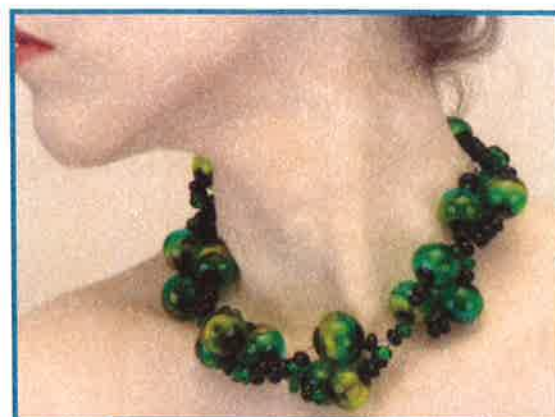
Lentilles d'eau : création de Valérie VAYRE - Bourges (verre filé)